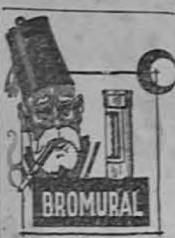
El fumar y otros placeres más fuertes

Los cablegramas que se publican en esta edición informan que el gobierno de Uruguay ha unido a la política de Argentina, Chile, Brasil y los Estados Unidos, que rechaza toda medida de coacción contra los beligerantes en el Chaco y en esa forma se ha comunicado a la Liga de Naciones. La reacción, en este caso, se refiere a la disposición adoptada por la Liga de Naciones para imponer el embargo de armamentos destinados a Paraguay.